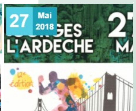
Trail des Gorges