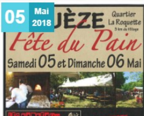
Fête du pain 5 et 6 Mai