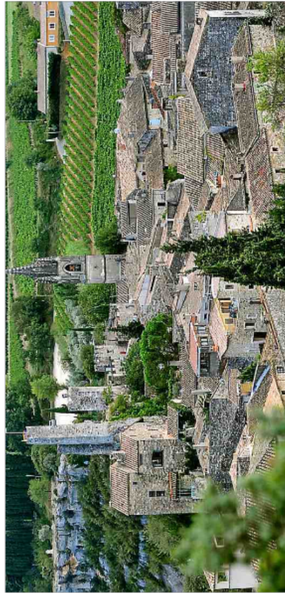
■ Ce plus beau village de France attire entre 350 000 et 450 000 visiteurs par an. MIKAËL ANISSET

Depuis leur arrivée aux affaires, ils s'efforcent d'avoir une vision d'ensemble. « Nous nous sommes occupés du hameau de la Blanchisserie pour valoriser cet espace. » Le bâtiment appartenant à la commune a été remis en état pour le proposer à la location. Éric Nicolle, le promoteur du Swingroller, a été soutenu