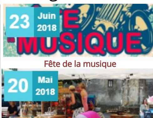
Brocante 20 et 21 Mai