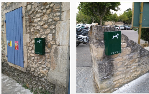
Pose de distributeurs pour sacs déjections canines