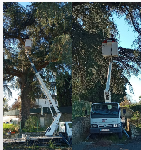
Travaux du Cèdre, diagnostics et mise en sécurité de l'arbre avec pose d'un hauban( financé par l'Association de l'Eglise)