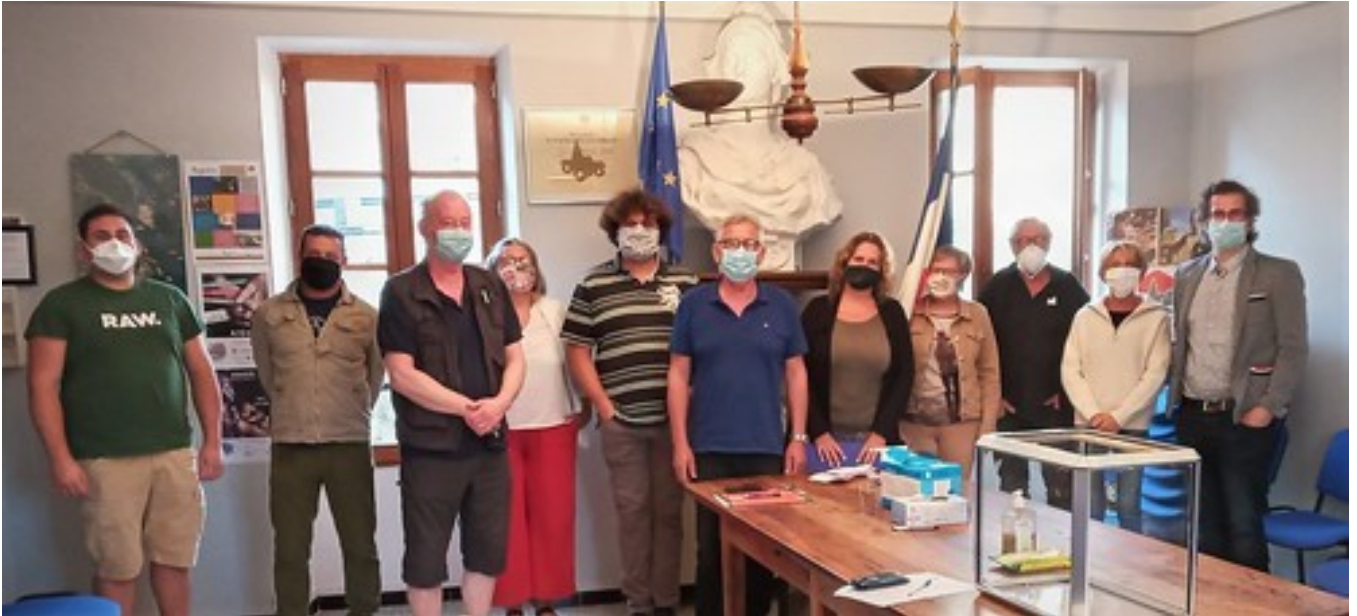
La nouvelle équipe municipale (de gauche à droite)