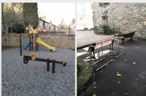
Réparations des jeux