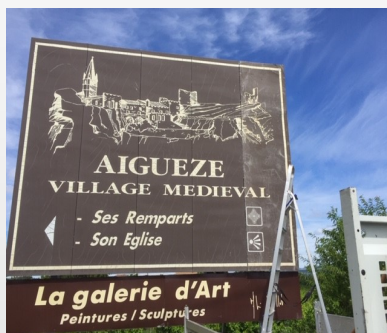
Réparation du panneau à Lamartine