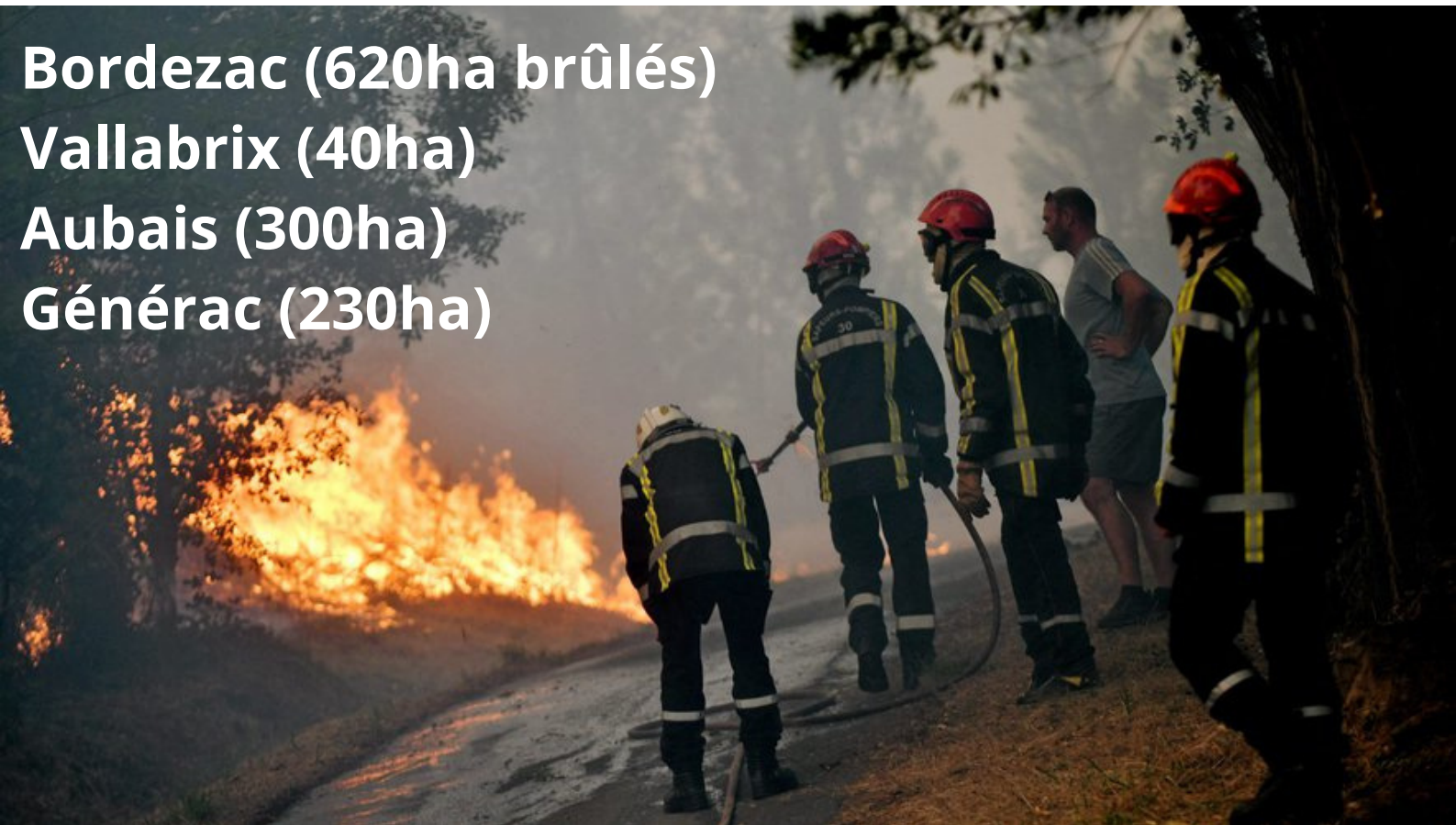
Photo prise par Midi Libre lors de l'incendie de Bordezac - Eté 2022

Rien que sur ces 4 feux, 3700 ha et 75 habitations sauvés. Cela équivaut à 75 M€ de gain sociétal